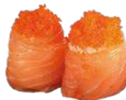
80 SUSHI GIO DI TOBIKO