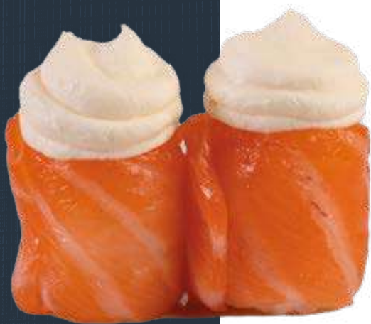
78 SUSHI GIO DI PHILADELPHIA (2 pezzi)