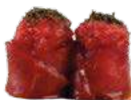
84 SUSHI GIO TONNO

Condito con olio extravergine e salsa ponzu, alghe verdi essiccate