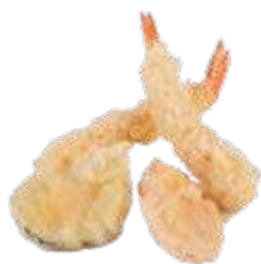
161 TEMPURA MIX* (4 PEZZI)