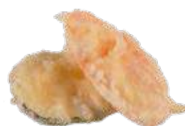
158 TEMPURA DI VERDURE (4PEZZI)