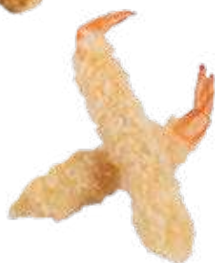
156 EBI TEMPURA * (2 PEZZI)