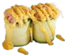
81 SUSHI GIO ZUCCHINE

Surimi, gamberi cotti con salsa zafferano, pasta kataifi