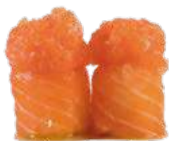
79 SUSHI GIO DI TARTARE DI SALMONE

Condito con olio extravergine e salsa ponzu