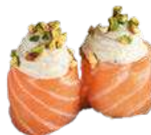
86 SUSHI GIO TARTUFO

Sushi gio salmone, crema di tartufo e granella di pistacchio